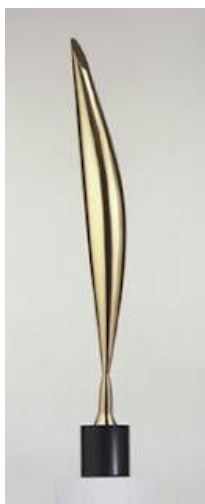
1923-24 Bird in Space (Yellow Bird) ora al Philadelphia Museum of Art

Nel 1926 altre due personali sono allestite presso la Wildensteine e la Brummer Gallery di New York.