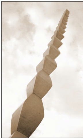
The Endless Column

monumento al progetto: un grande tavolo rotondo in pietra soprannominato The Table of Silence , circondato da 12 sedute in pietra. L'intenzione di Brancusi è di creare un percorso lungo la riva del fiume, che dal grande tavolo accompagni il visitatore oltre il portale, verso la Colonna dedicata ai caduti: una passeggiata attraverso il parco di Tirgu Jiu si trasforma così in momento di riflessione profonda,