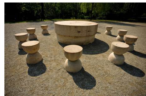
The Table of Silence

monumento al progetto: un grande tavolo rotondo in pietra soprannominato The Table of Silence , circondato da 12 sedute in pietra. L'intenzione di Brancusi è di creare un percorso lungo la riva del fiume, che dal grande tavolo accompagni il visitatore oltre il portale, verso la Colonna dedicata ai caduti: una passeggiata attraverso il parco di Tirgu Jiu si trasforma così in momento di riflessione profonda,