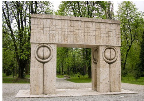
Gate of the Kiss

L'anno seguente si apre il celebre Caso Brancusi : Edward Steichen vuole portare oltreoceano una delle numerose versioni della scultura Bird in Space , che ha acquistato in Europa, per esporla ad una retrospettiva dell'opera di Brancusi organizzata a New York. Gli ufficiali della dogana americana classificano la scultura come utensile da cucina e dunque oggetto prodotto in serie, non originale, sottoposto al pagamento di una tassa d'importazione. Lo