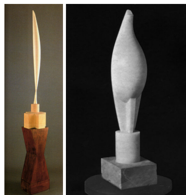
destra: Maistra , 1911 sinistra: Bird in Space , 1925