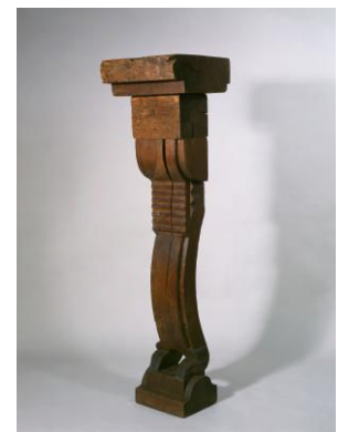
Caryatid II , 1914-26

Le due Caryatidi lignee degli anni 1915-20 ( Caryatid e Caryatid II ), suggeriscono, già nel nome, questo proposito: la figura femminile scolpita, tradizionalmente usata in luogo di colonna o pilastro a sostegno di sovrastanti membrature architettoniche, da elemento strutturale portante diviene opera