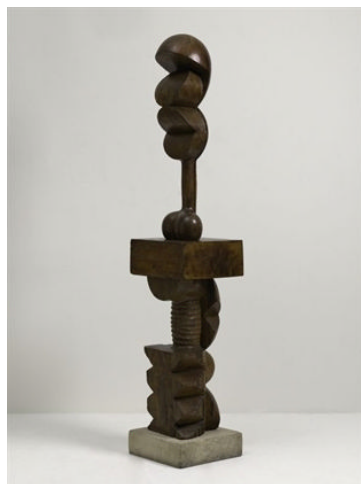
Adam and Eve , 1916-21

Lo scultore, infatti, era solito ripetere « everything must start from the ground », personale aforisma che esprimeva un concetto puntualmente confermato da ognuna delle sue sculture: ogni sezione, ogni dettaglio, ogni particolare dell'opera va studiato e progettato con estrema cura e rifinito con minuzia (attenzione che si traduce nell'abitudine quasi maniacale di levigare accuratamente e lucidare a specchio le superfici delle sue sculture).